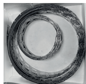
521.0000.024 Reggia di fissaggio in acciaio per cavi scaldanti autoregolanti da fissare su gronde e tetti Steel fixings for self-regulating heating cables to be fixed on gutters and roofs Montageband aus Stahl für selbstlimitierende Heizleiter zur Befestigung an Dachrinnen und Dächern