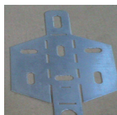
521.0000.050 Supporto per sensore gronde in rame Copper support for gutters' sensor Kupferhalterung für Dachrinnen-Fühler